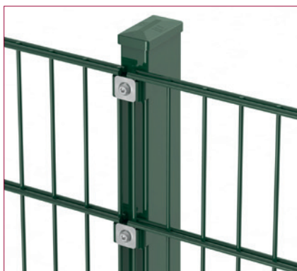
Poteaux O-Lox Super avec plaques de fixation en inox 30 x 30 mm et boulons M8 x 40 mm